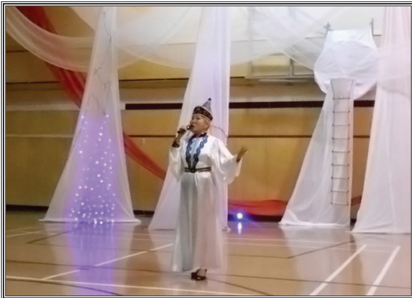
Калмыцкая народная песня «Ялуха»