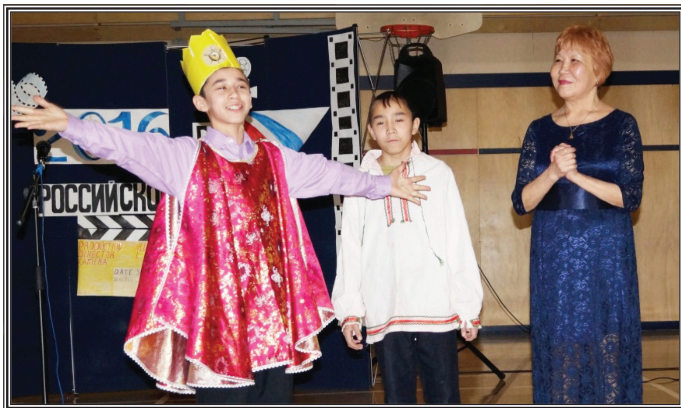
Царь Иван Васильевич, его холоп, нянюшка – ведущие концерта, посвященного открытию Года российского кино в Центре образования.