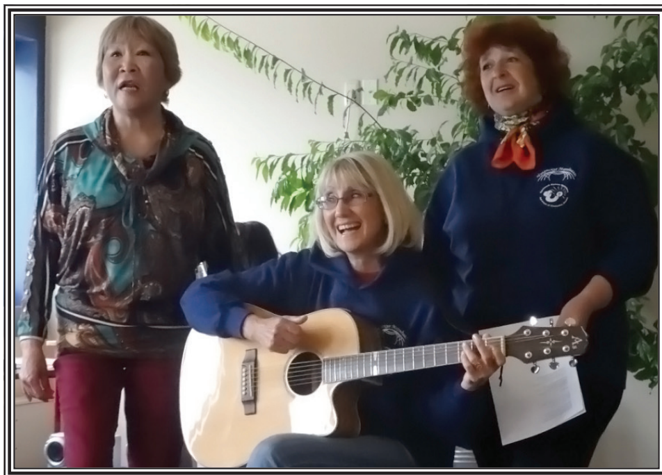
У нас в гостях бардовский дуэт «Белый ветер»

Таким образом, воспитание лучших человеческих качеств, уважение к культуре, к лучшим песенным образцам прошлого способствует и воспитанию глубокого эстетического чувства, преклонения перед вечным Прекрасным.