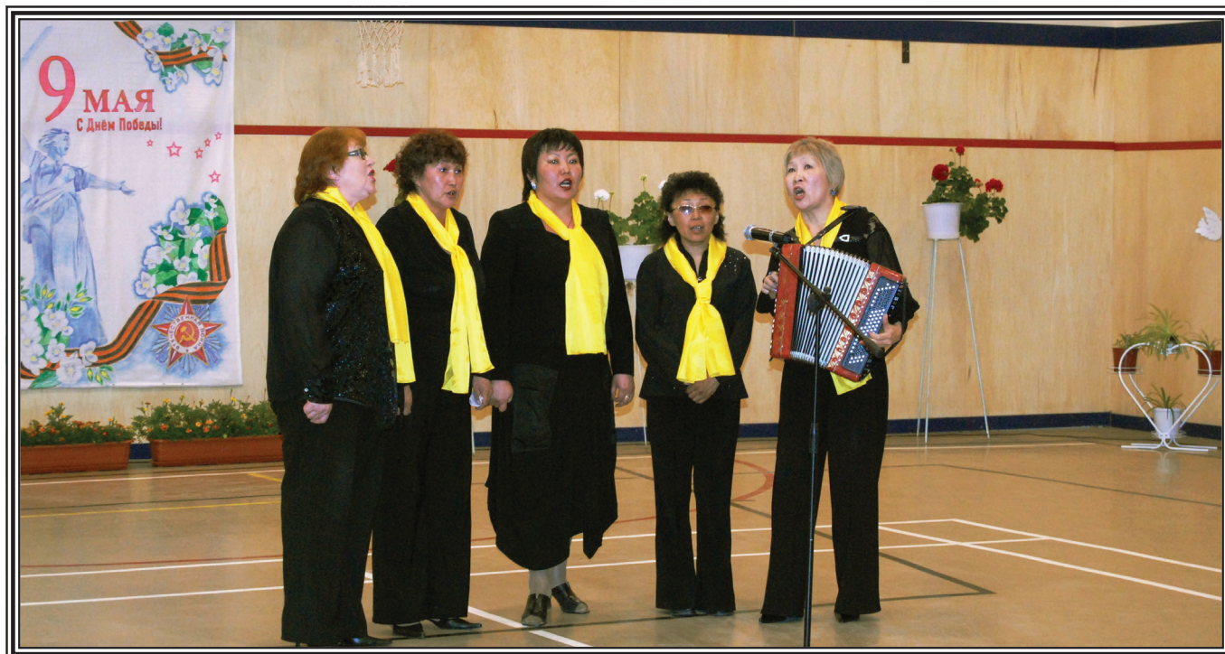
Выступает вокальная группа учителей – призеры районного конкурса патриотической песни «Виктория»

Лучшие песни каждой эпохи, представляя особенности развития культуры данного времени, способствуют развитию у ребят интереса к изучению прошлого и настоящего своей Родины.