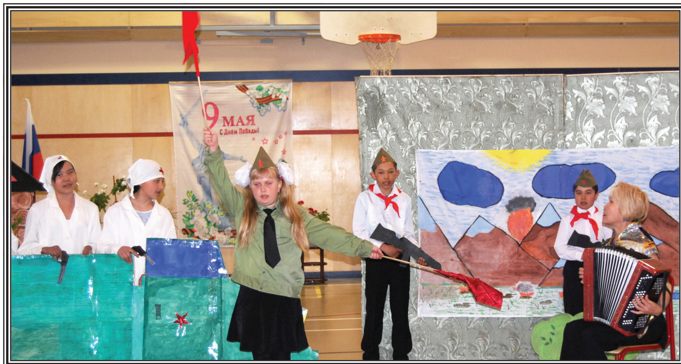
«Через горы, реки и долины...» - исполняют артисты музыкального клуба