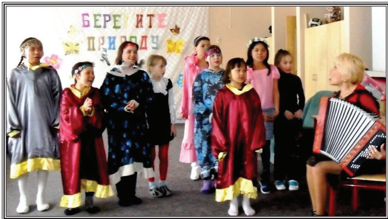
Музыкальная постановка «У дороги чибис»

Музыкальный клуб объединяет ребят - любителей песни. Песня воспитывает душу. Она не только погружает ребенка в конкретную историческую среду, но и способна привести его в состояние восторга и душевного экстаза. В этом состоянии все окружающее растворяется в могучем наслаждении гармонией музыки и слов. Эта природная способность человека, развивая которую педагоги могут затронуть и другие устремления к творчеству, помогут детям понять принципы других видов искусства: живописи, поэзии, танца.