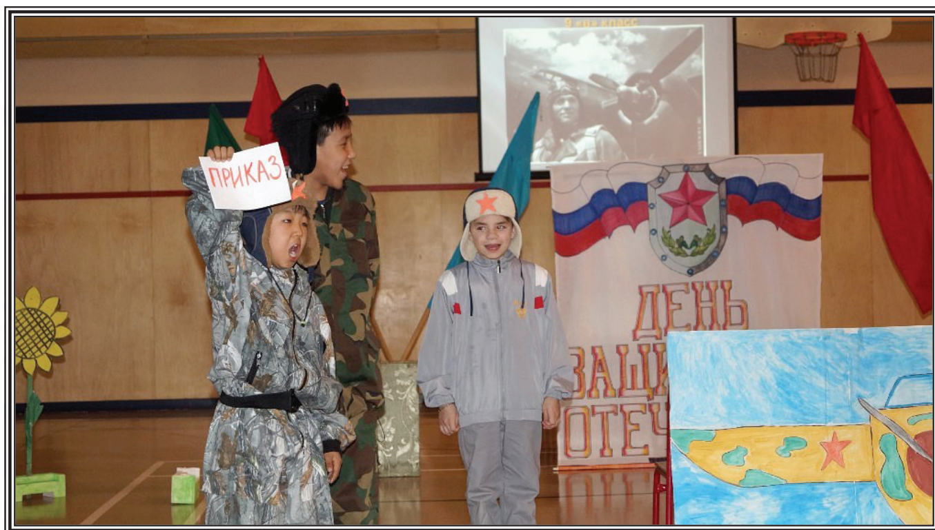
«А назавтра приказ улетать!» - с инсценированной песней «Потому что мы – пилоты!»

Понятие « патриотическая песня» имеет более глубокий смысл, чем просто выражение своей любви к Родине. Воспитание патриота означает не просто преданность и привязанность к родным местам, но глубокое уважение к истории, культуре и традициям своего народа.