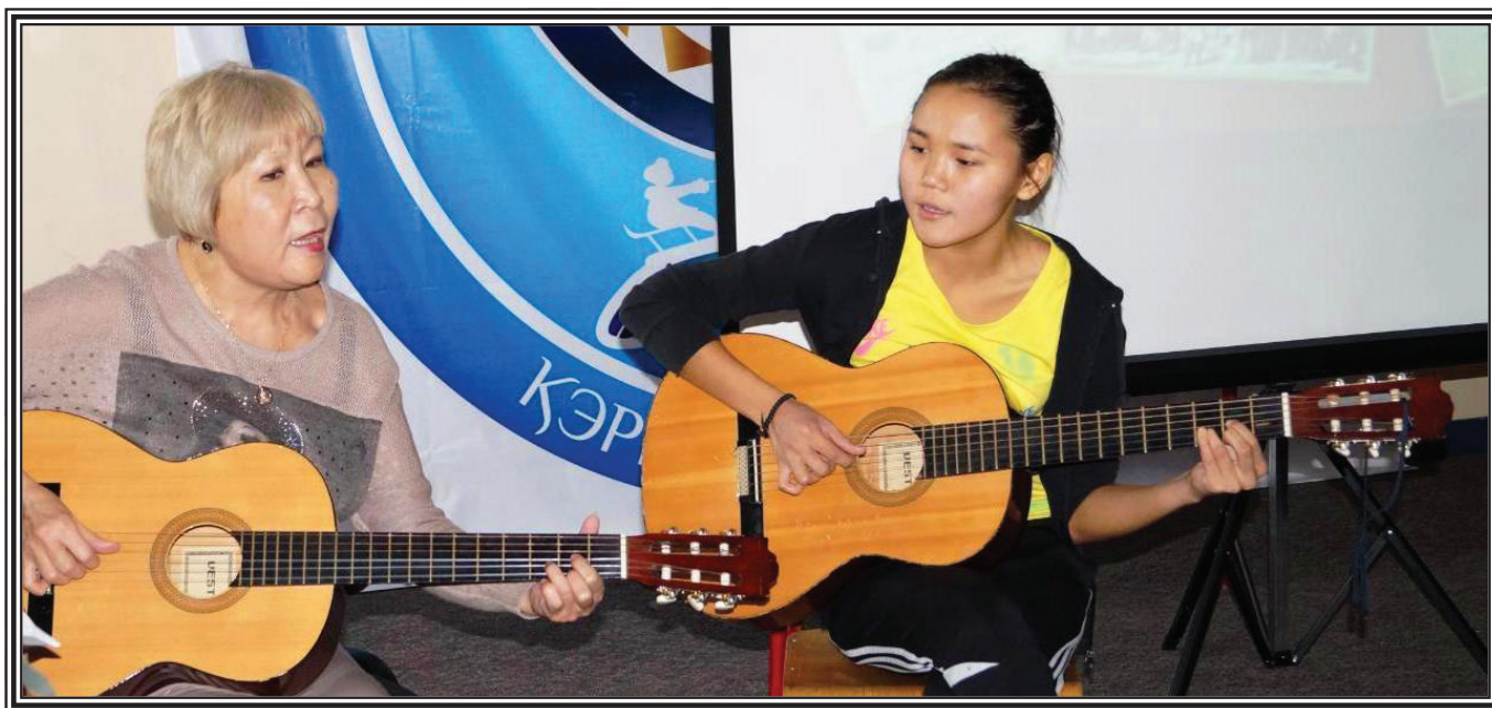
Исполняется романс на стихи С.Есенина «Спит ковыль, равнина золотая»

Изучая романсы на стихи Пушкина, Лермонтова, Тютчева, Фета и др., дети проникаются светлым эстетическим чувством, которое всегда является отражением прекрасного в искусстве.