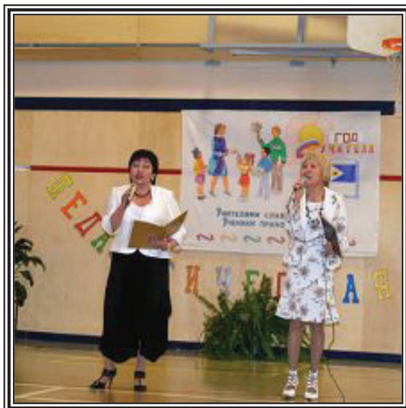
«Педагогическая поэма» - музыкальная постановка на открытие Года учителя