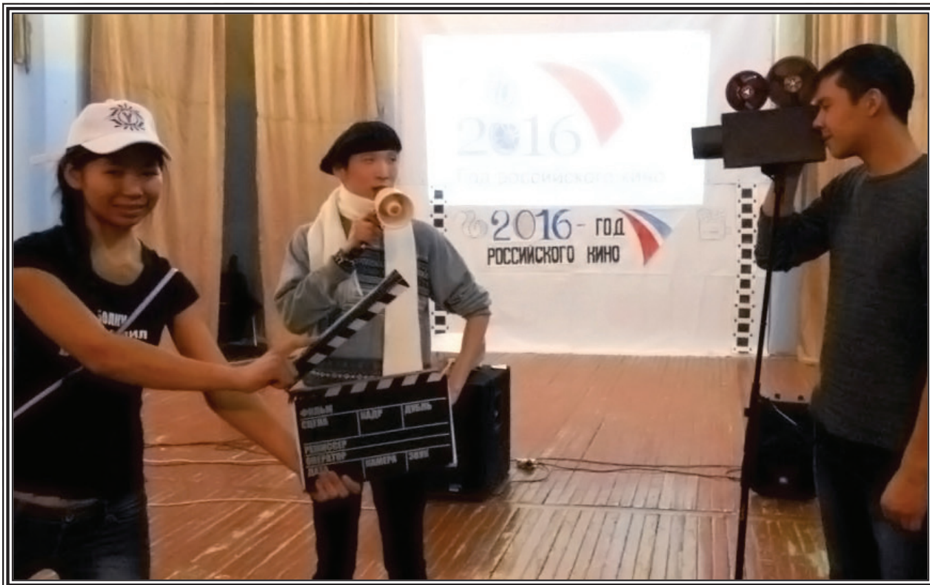
Артисты школьной «Мозаики» - участники музыкальных постановок на сцене сельского клуба