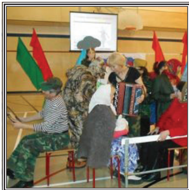
«Песенка фронтового шофера» - музыкальный подарок ветеранам войны в честь 70-летия Великой Победы от учителей Центра образования

На занятиях идёт обучение игре на гитаре . Гитара всегда пользовалась огромной популярностью в молодежной среде. Умеющие играть на этом великолепном музыкальном инструменте приобретают дополнительную возможность раскрывать, объяснять многие жизненные ситуации, которые имеют для молодежи личностный смысл.