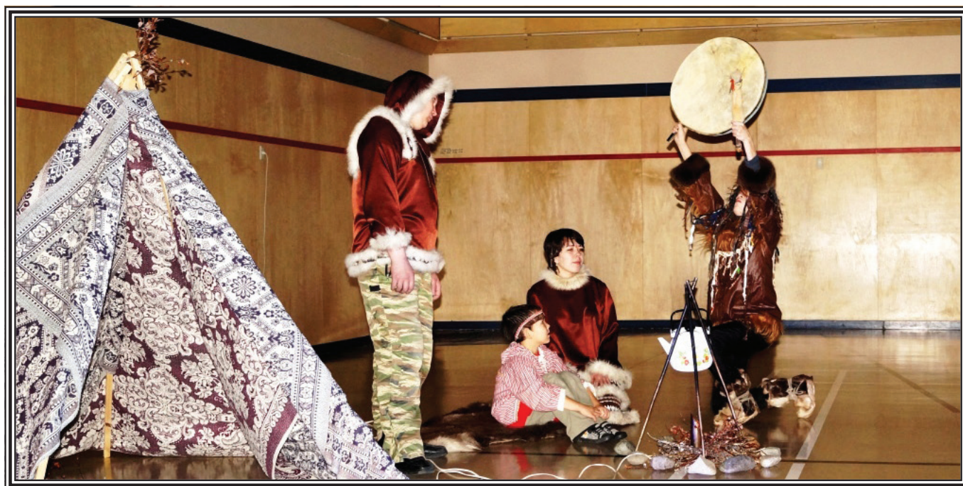
Музыкальная композиция «Звуки родного Севера» с участием родителей

Об эстетической ценности песен этих известных авторов говорит уже тот факт, что эти песни пели наши мамы, а сегодня они до сих пор звучат с эфира. И благодаря нам, взрослым, эти песни поют наши дети.