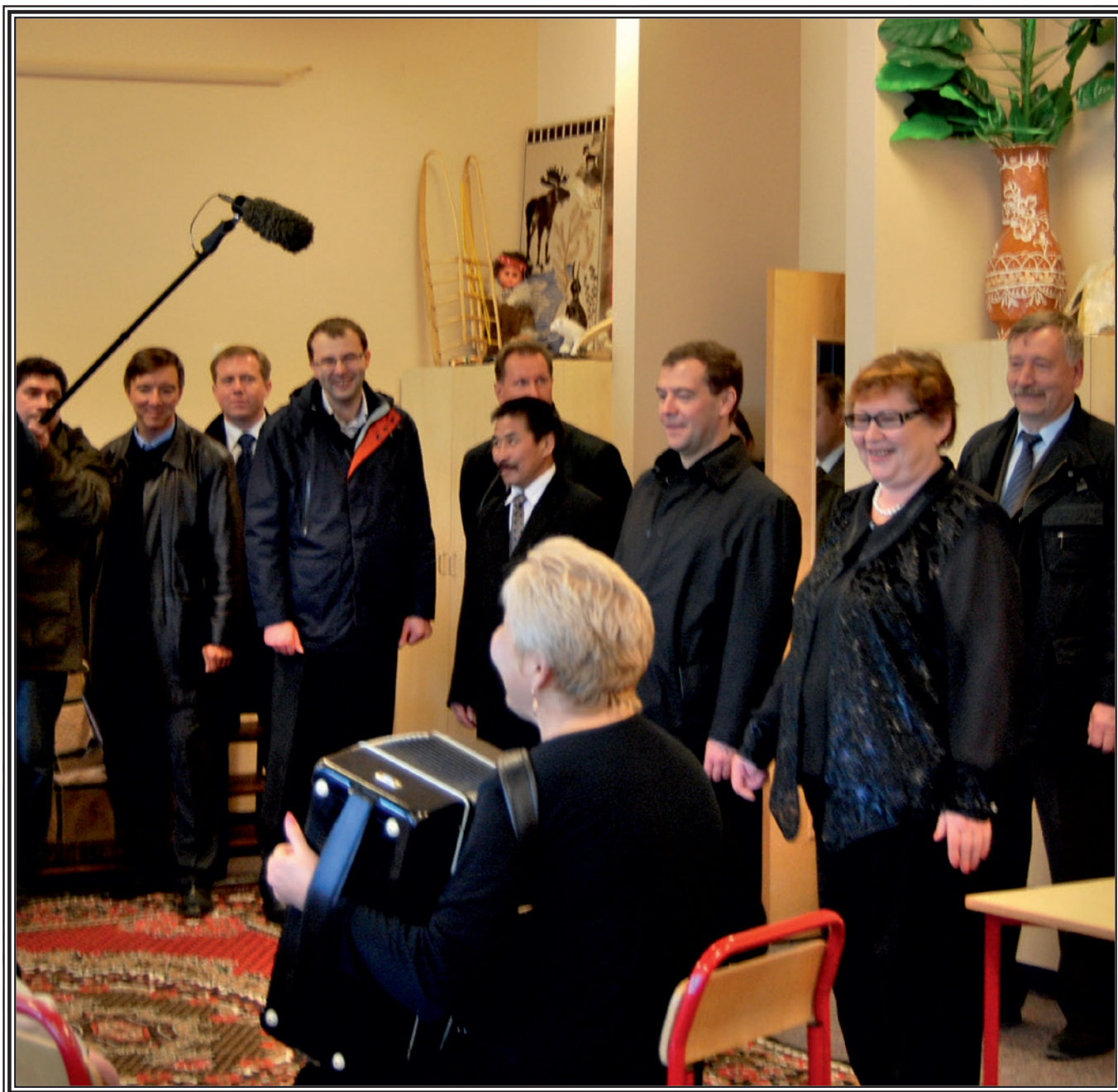
Президент Российской Федерации Дмитрий Медведев – почетный гость музыкального клуба «Мозаика»