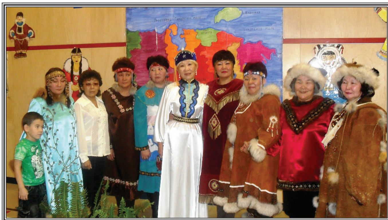
Участники концерта в честь 80-летия Чукотского АО

Лучшие песни каждой эпохи, представляя особенности развития культуры данного времени, способствуют развитию у ребят интереса к изучению прошлого и настоящего своей Родины.