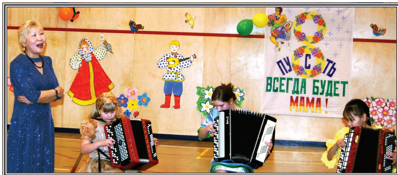
Калмыцкая народная песня в исполнении музыкального руководителя, аккомпанирует трио баянистов клуба «Мозаика»

Очень важно привить детям с раннего возраста интерес к культурному наследию каждого народа.