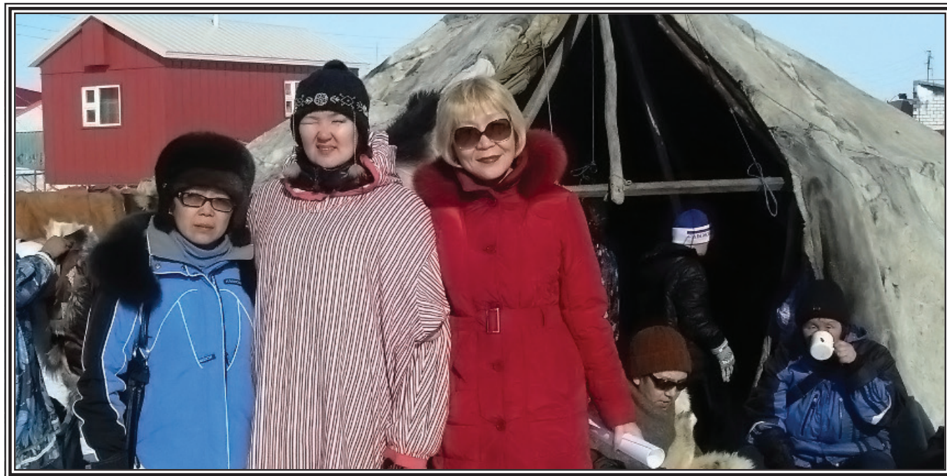
Участники концерта чукотского народного праздника «Кильвей» – учителя Центра образования