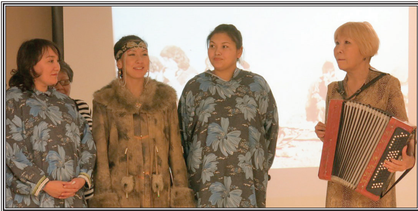
На традиционном фестивале «Эргав» звучит песня о родном Канчалане

Об эстетической ценности песен этих известных авторов говорит уже тот факт, что эти песни пели наши мамы, а сегодня они до сих пор звучат с эфира. И благодаря нам, взрослым, эти песни поют наши дети.