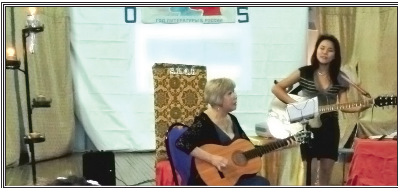
Романс П.И.Чайковского «Растворил я окно»

Вечера романсов предполагают и особое оформление, и обстановку: полумрак, свечи, цветы, гитара... Эмоционально воздействуя на человека, романс затрагивает самые сокровенные уголки нашей души красотой и мелодичностью высокого поэтического слога.