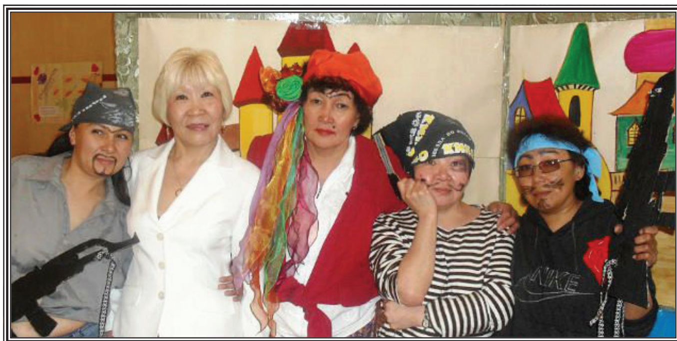
Наши учителя - разбойники в музыкальной постановке «Бременские музыканты»

Не потому ли так талантливы ученики , что необыкновенно талантливы их учителя?