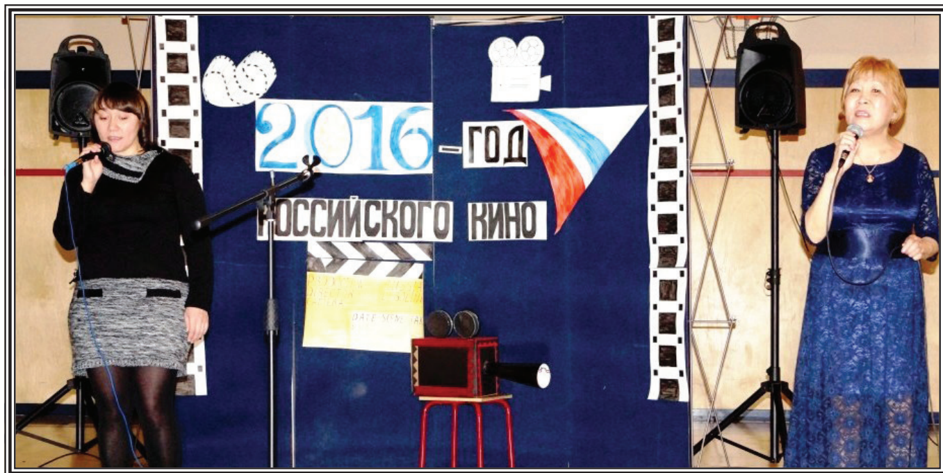
Песня на стихи Рабиндраната Тагора из фильма «Вам и не снилось»

Дети, часто повинувшись слепой моде, тянутся к такой дешевой приманке. Поэтому моя задача заключается в том, чтобы из всей этой радио- теле продукции выбрать наиболее достойное, представляющее состояние современной эстрады. Это песни О.Газманова, Б.Гребенщикова, Ю.Шевчука, Розенбаума и мн.др., о которых можно сказать, что они продолжают лучшие песенные традиции.